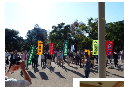
上：憲法記念日の護憲集会