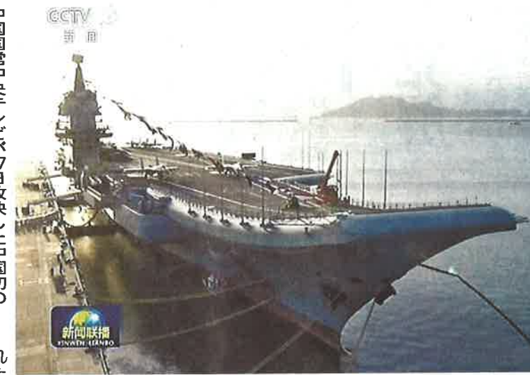
中国国営中央テレビが17日放映した中国初の国産空母「山東」

る姿勢を改めて示すものとなる。習氏は建国70周年の記念の年に自ら掲げる「強軍」路線の進展を誇示した形。ネット上には「すごいぞ、わが国」などの書き込みが相次ぎ、祝賀ムードに沸いた。国産空母は遼寧(排水量5万トン)を基に設計。動力は通常型で、2013年11月に大連で着工した。17年4月に進水し、18年5月から試験航海を開始。今年11月17日に台湾海峡を通過後、南シナ海に向かった。遼寧が搭載できる艦載機は24機だが、国産空母は少なくとも36機が増えるなど改良が施された。ただ、60機以上の艦載機を搭載する米国の空母に比べると少ない。遼寧同様にそり上がった船首から艦載機が発艦するスキージャンプ式を採用。艦載機の重量が制限されるため武器や燃料を満載できず、爆撃機や早期警戒管制機は運用できない。攻撃や探知の能力が制約されるため、「中国本土から遠く離れた海域での運用は困難」(軍事専門家)という見方が強い。