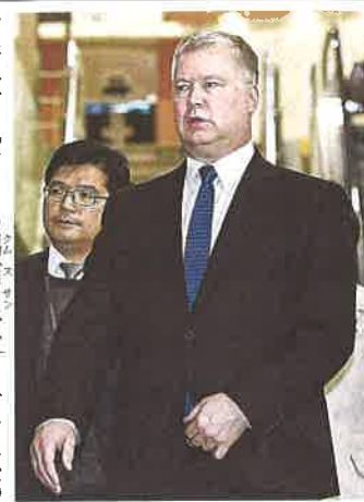
17日、日本に向けて出発する米国のビーガン北朝鮮担当特別代表（韓国・金浦空港）