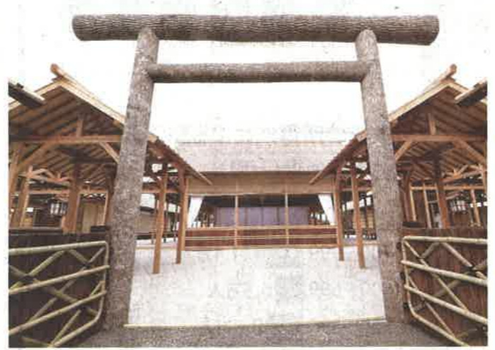
「大嘗宮の儀」が行われるのを前に、報道陣に公開された大嘗宮＝皇居・東御苑で13日

天皇陛下の即位に伴う皇室行事「大嘗祭」の中心的儀式「大嘗宮の儀」が14、15日に行われるのを前に、宮内庁は13日、会場となる皇居・東御苑に建設された大嘗宮を報道陣に公開した。大嘗宮の儀では、陛下が新穀などを、皇室が祖とする天照大神や神々に供えて自らも食し、国や国民の安寧、五穀豊穡を祈られる。大嘗宮は、陛下が儀式に臨む「悠紀殿」「主基殿」など約30棟の建物群で構成されている。宮内庁は、経費削減を図るため敷地面積を前回より約2割縮小し、一部の建物を木造からプレハブに切り替えた。清水建設が9億5700万円で建設工事を受注し、10月末にはほぼ完成させた。建物は21日~12月8日に外観が一般公開された後、撤去される。【稲垣衆史、大久保和夫】