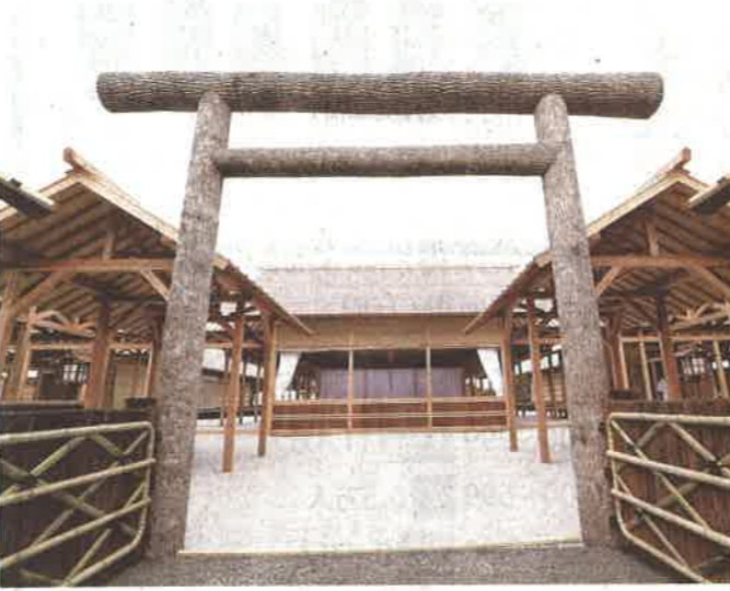
「大嘗宮の儀」が行われるのを前に、報道陣に公開された大嘗宮一皇居・東御苑で13日

た可能性がある。 内閣府は、予算案を審議中の毎年2月下旬〜3月上旬ごろ、その年の開催に向けて2業務の入札を公告しており、今年二つの入札も14〜18年と同じ業者がそれぞれ応募した。内閣府は、予算成立(3月27日)直後の4月1日、両社とそれぞれ契約を締結し、会は13日に東京・新宿御苑で行われた。契約額は「飲食物の提供」が予算の約3・5倍の約2191万円、「会場等設営」は2倍以上の約1814万円だった。内閣府の担当者は「招待者の配属者や未成年の家族の参加もあり、参加者数は想定が難しい。予算案の策定時には最低限必要な経費として毎年同じ額を計上している。会計法を逸脱しているわけではなく問題ない」と説明した。 【秋山信一、堀和彦】