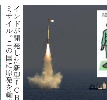
インドが開発した新型ICBMミサイル。この国に原発を輸出する権政倍安