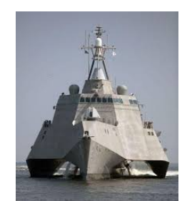
攻撃力を高めるための最新型イージス艦