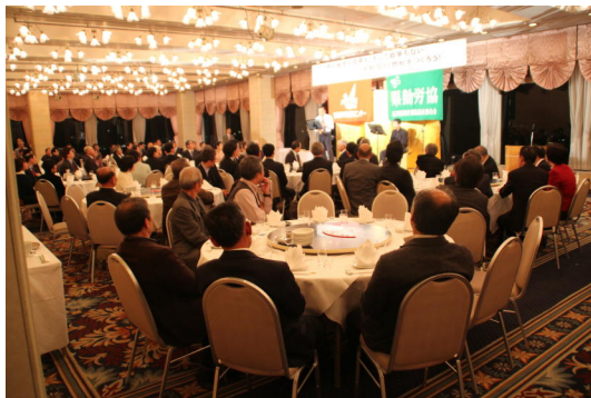
15歳ホリデザイン金沢スカイ